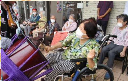
太鼓も体験できました。