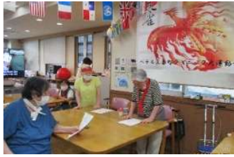
力強く選手宣誓をしてくださいました。