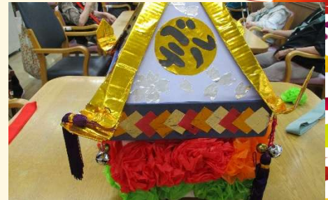
ベテルのお神輿も作ったよ